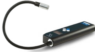
Gasschnüffler H2 (Symbolbild)