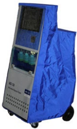
Schutzplane für ADS 130D