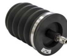
Hermetisch verschließbarer Ölbehälter