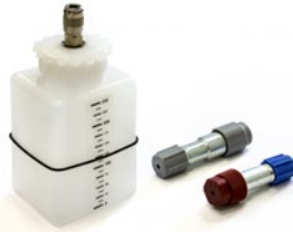
Aufrüstset für Hybrid-Fahrzeuge