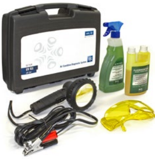
Klima UV Lecksuchset