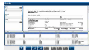
Ergebnisprotokoll mit Firmenlogo zur Kundenbindung