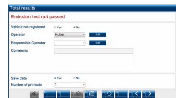
Klare Darstellung der Ergebnisse