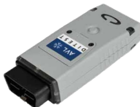
AVL DITEST VCI 1000