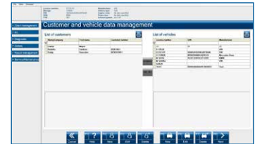
Integrierte Kunden- und Fahrzeugverwaltung

Machen Sie sich selbst ein Bild davon, wie einfach und schnell eine AU sein kann: Von der Kundenerfassung über die Durchführung bis hin zum Ergebnisprotokoll werden Sie eindeutig und effizient durch den Arbeitsprozess geleitet.